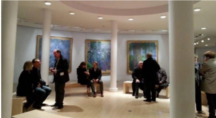
Many Museum visits / Theatre evenings