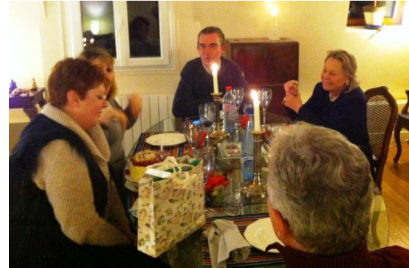
8 home dinners