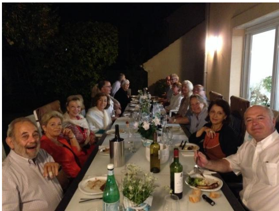
4 garden dinners